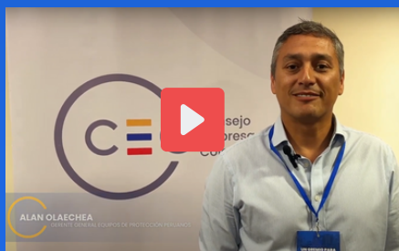
EQUIPOS DE PROTECCIÓN PERUANOS