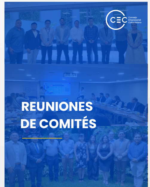
NOTICIAS SOCIOS CEC