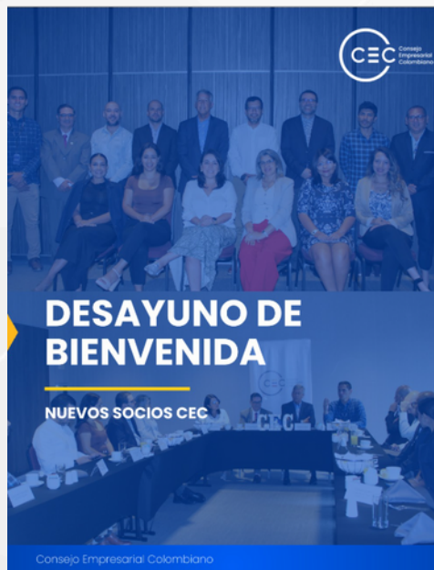
DESAYUNO DE BIENVENIDA