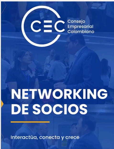
NETWORKING DE SOCIOS