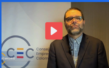
MAIL BOXES ETC